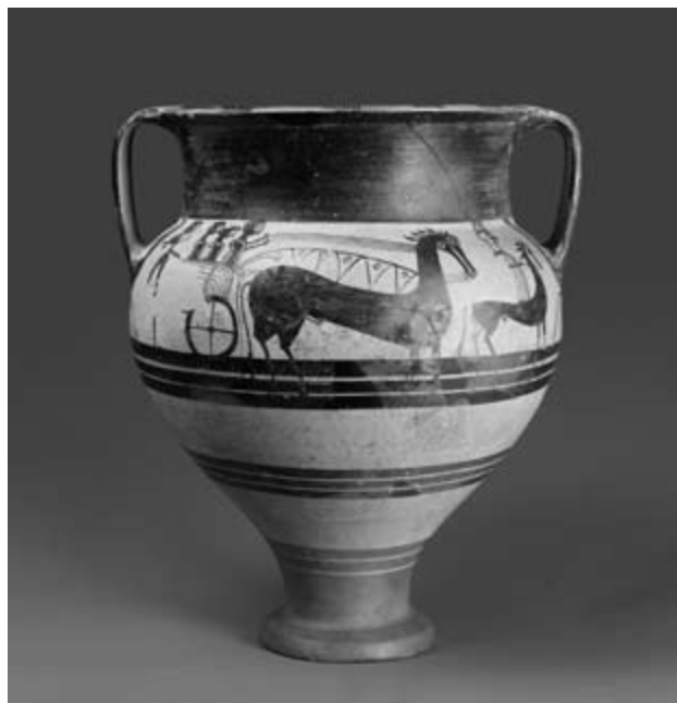
Myceens mengvat (krater) met afbeelding van een ruiter, strijdswagen en een lopende figuur met zwaard. Aardewerk, gemaakt op de Peloponnesos, gevonden op Cyprus, ca. 1300-1250 v. Chr.

De volgende nieuwsbrief zal kort na de zomer worden verstuurd. Daarin meer nieuws over de activiteiten in het najaar en de aankondiging van een spectaculaire tentoonstelling over Troje! In 2012 staan Turkije en Nederland stil bij 400 jaar onderlinge diplomatieke betrekkingen. In het kader van dit feestelijke herdenkingsjaar organiseert het museum van 7 december 2012 t/m 5 mei 2013 de tentoonstelling Troje. Stad, Homerus en Turkije . De tentoonstelling geeft aan de hand van de zeer tot de verbeelding sprekende onderwerpen Troje en Homerus een beeld van de Turkse omgang met dit cultureel erfgoed dat aan de basis ligt van de Europese cultuur. Is het Homerische erfgoed gedeeld erfgoed van Turkije en het westen? De bezoeker krijgt inzicht in de receptie van Homerus in Turkije en wordt ondergedompeld in de Trojaanse wereld aan de hand van topstukken uit Troje uit Turkse archeologische collecties en de eigen collecties van het Allard Pierson Museum.