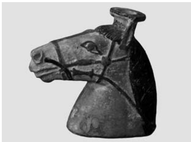
Olieflesje in de vorm van een paardenhoofd. Met roodbruine verf is het leer van het halster en de teugels weergegeven.

Bij het Mongoolse deel verschijnt ook de publicatie Paard & Ruiter op de steppe van Mongolië . In deze publicatie komen de nomadische steppevolken uit Centraal-Azië aan bod, die in West-Europa lange tijd louter bekend waren door de veroveringstochten van Djenghis Khan. Naar aanleiding van recente archeologische vondsten en nieuw onderzoek, uitmondend in de tentoonstelling, staan ze nu opnieuw in de belangstelling. Het boek telt 96 pagina's en wordt uitgegeven door WBOOKS. Vrienden van het Allard Pierson Museum ontvangen € 3,- korting op dit boek: in plaats van € 17,95 betaalt u slechts € 14,95. Deze korting geldt alleen in de winkel van het museum, op vertoon van uw ledenpas en deze brief, en gedurende de periode van 15 mei tot en met 15 augustus 2012 (actiecode: 90193798).